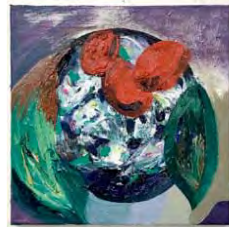
Puppy Öl auf Gewebe 30 x 30 cm 2026