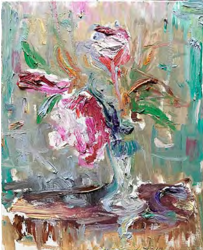
Peonies Öl auf Gewebe 50 x 40 cm 2026