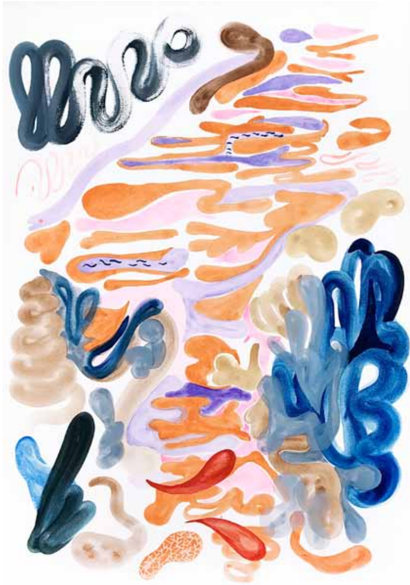
Schleiche Aquarell 90 x 70 cm 2024