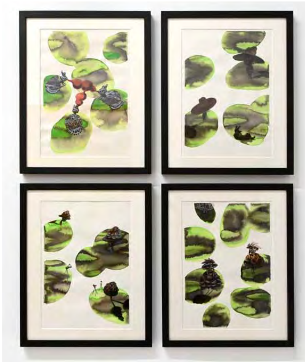
Dots and Dolls Installationsansicht Emde Gallery Mainz Aquarell, Gouache, Tusche auf Papier je 30 x 20 cm, 15teilig (Auswahl) 2016