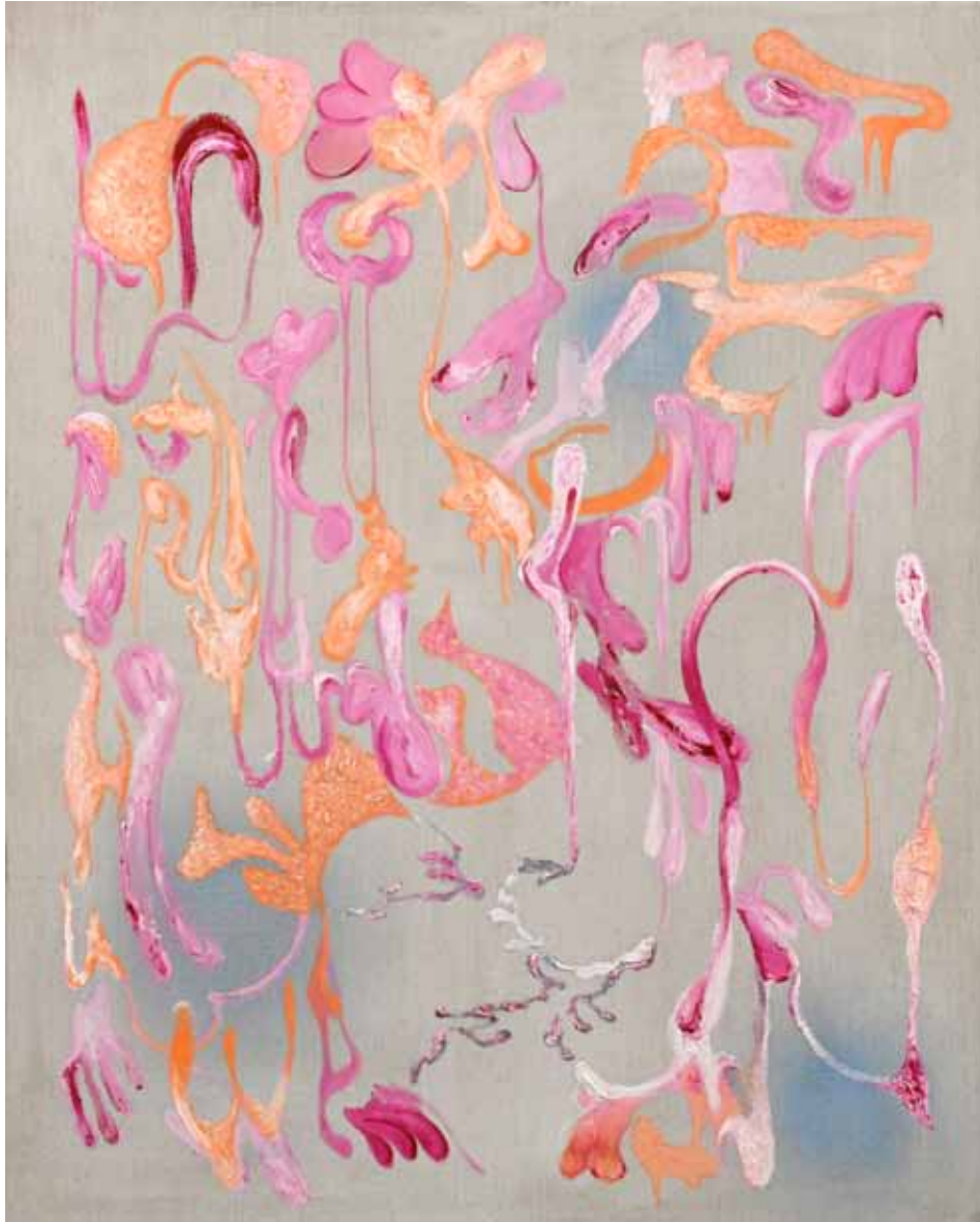
Circulating Days Öl auf Leinwand 150 x 120 cm 2023