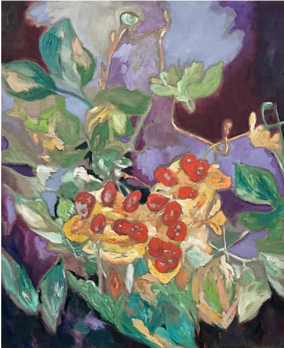
Red Drops Öl auf Rohleinen 170 x 130 cm 2026