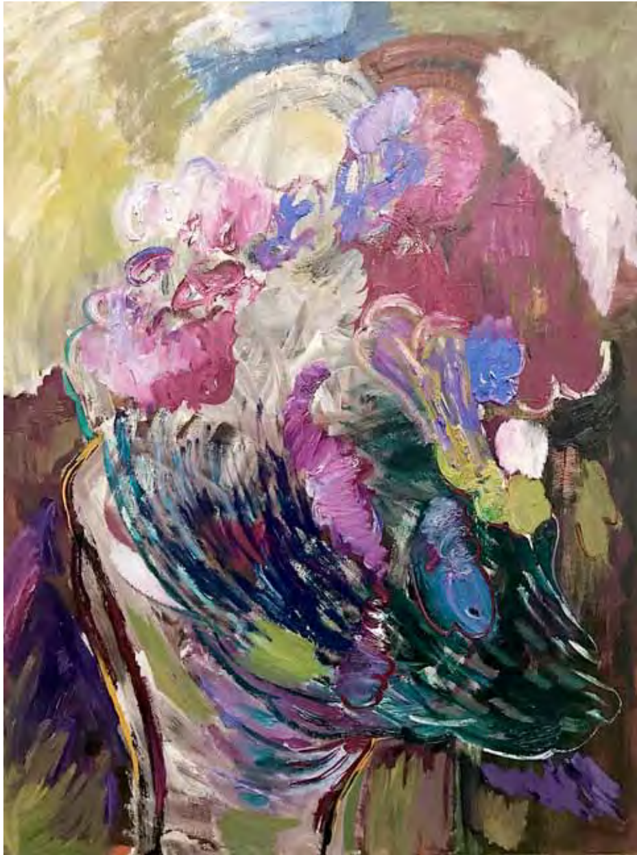
Pudel Öl auf Gewebe 170 x 130 cm 2025