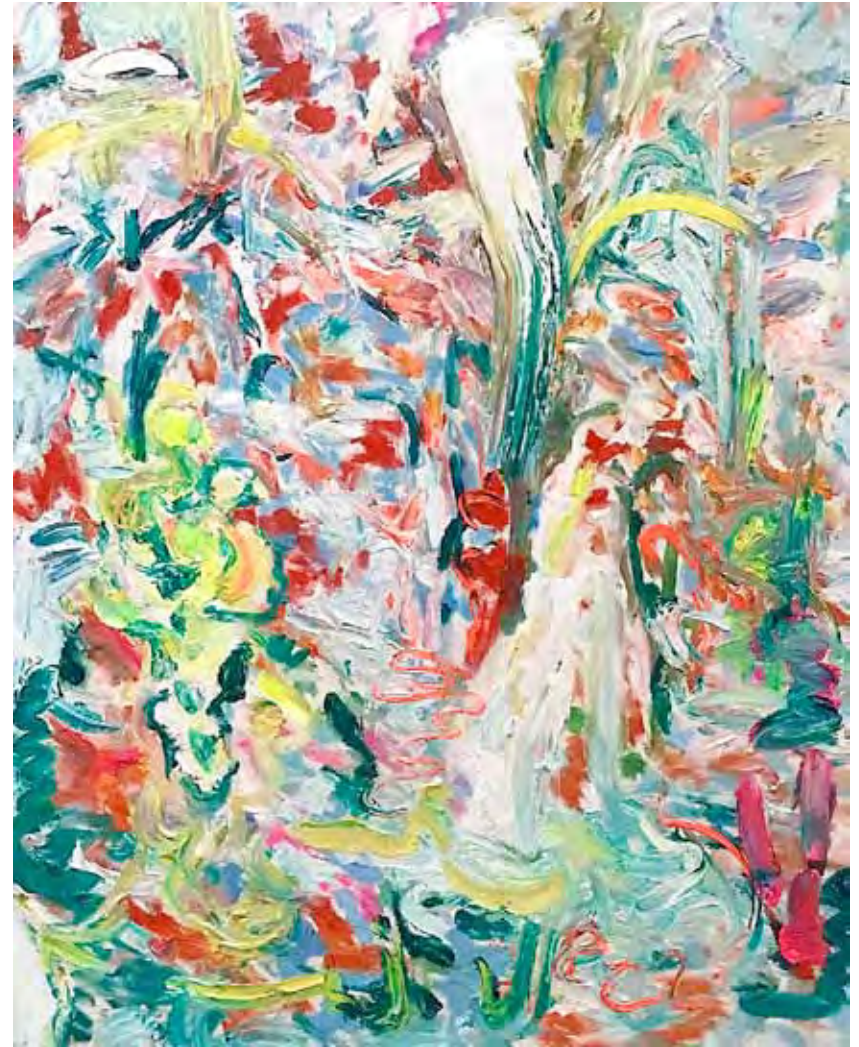
The Garden Öl auf Gewebe 120 x 100 cm 2025