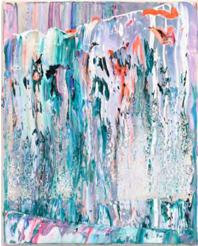
Mindscape Öl auf Gewebe 40 x 30 cm 2024