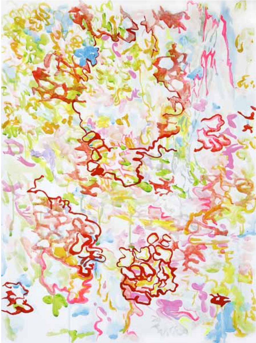
Liquid Summer Aquarell 80 x 60 cm 2024