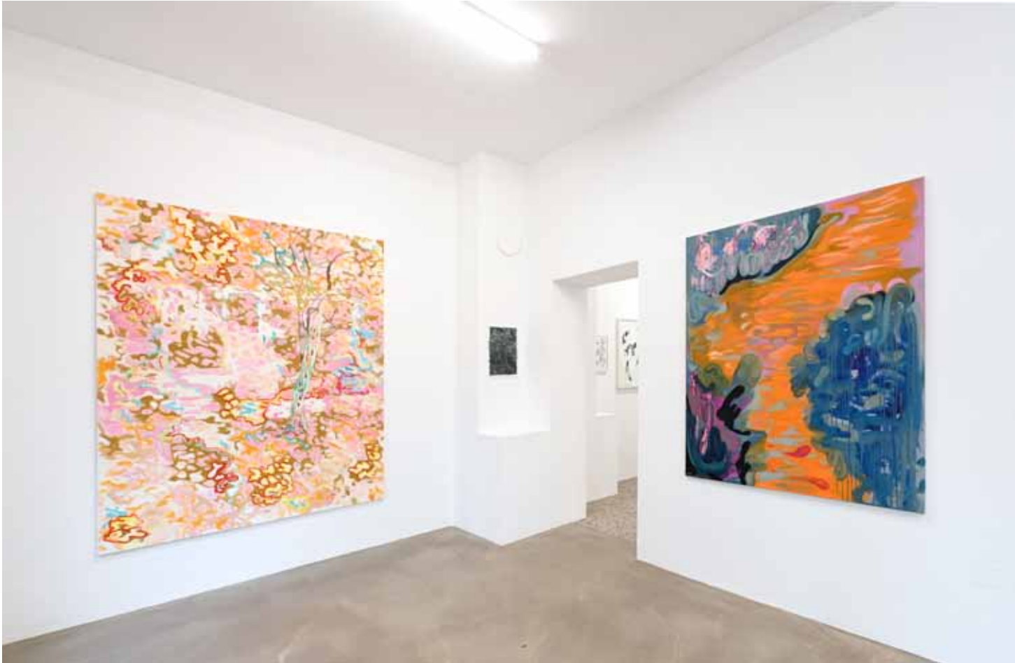
Liquid Summer, 2021 Schleiche, 2023 Installationsansicht Emde Gallery Mainz