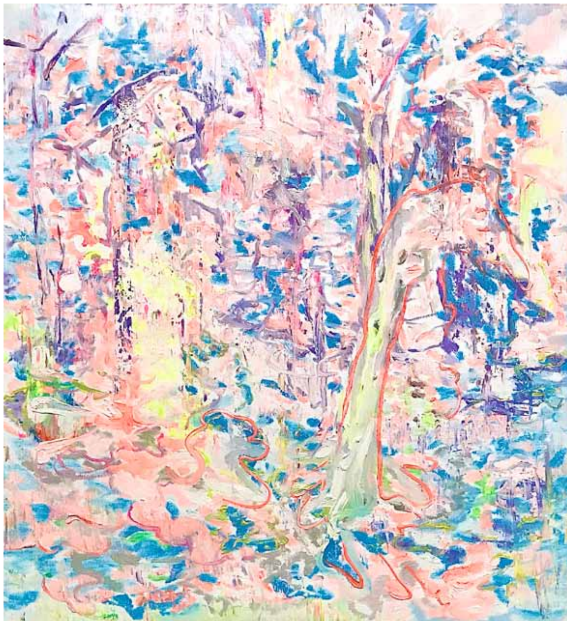
Forêt Öl auf Gewebe 150 x 140 cm 2025