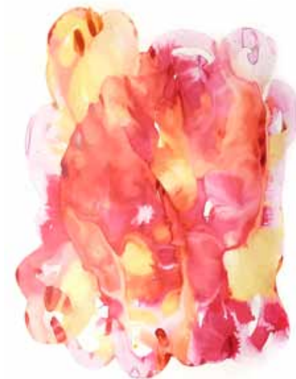
Nektar Aquarell 80 x 60 cm 2025