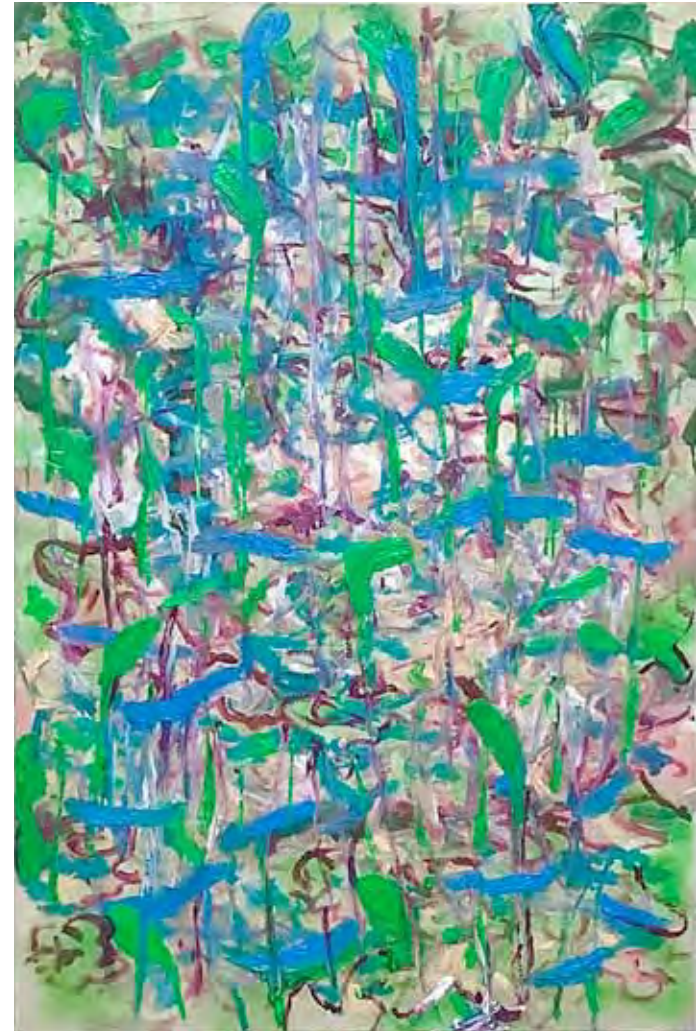
Dickicht Öl auf Gewebe 150 x 100 cm 2025