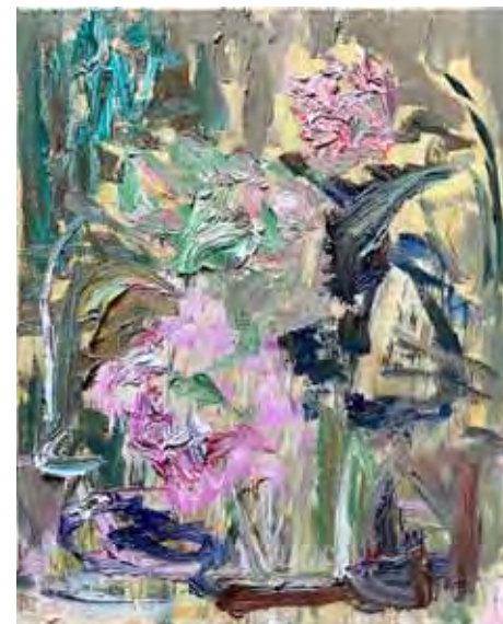
Pink Peonies Öl auf Leinwand 50 x 40 cm 2026