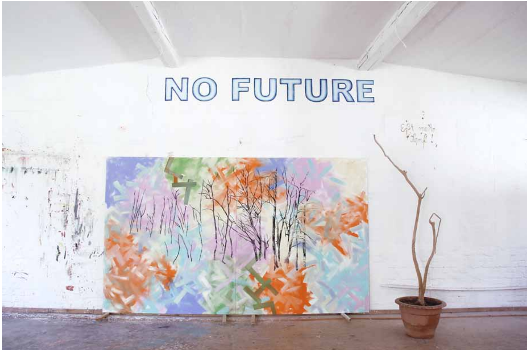
Failed Forest Installationsansicht Studio Weizenfeld 2022 Öl auf Gewebe 200 x 340 cm, zweiteilig 2022