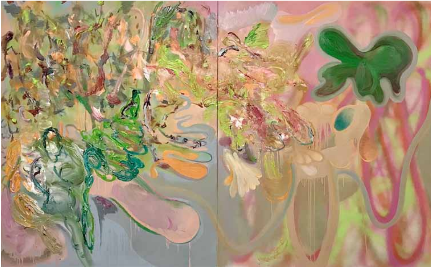
Eden Öl, Spraypaint auf Gewebe 150 x 240 cm, zweiteilig 2023