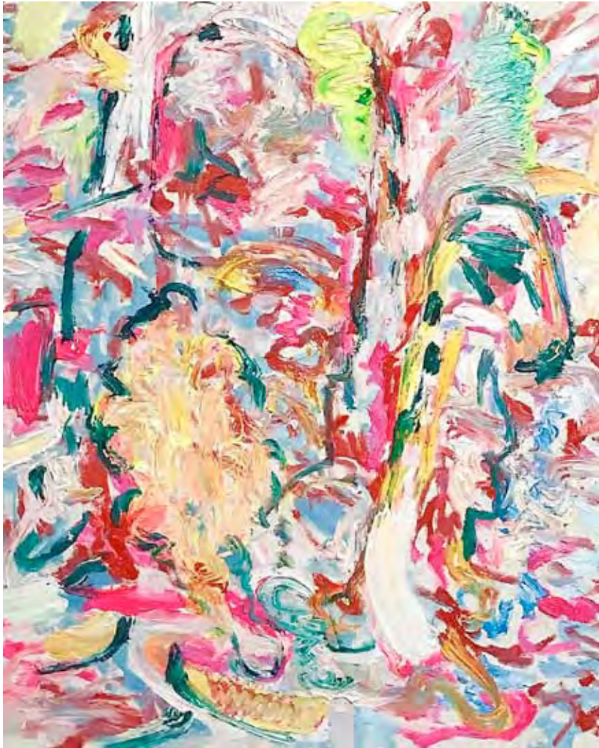
The Garden Öl auf Gewebe 120 x 100 cm 2025