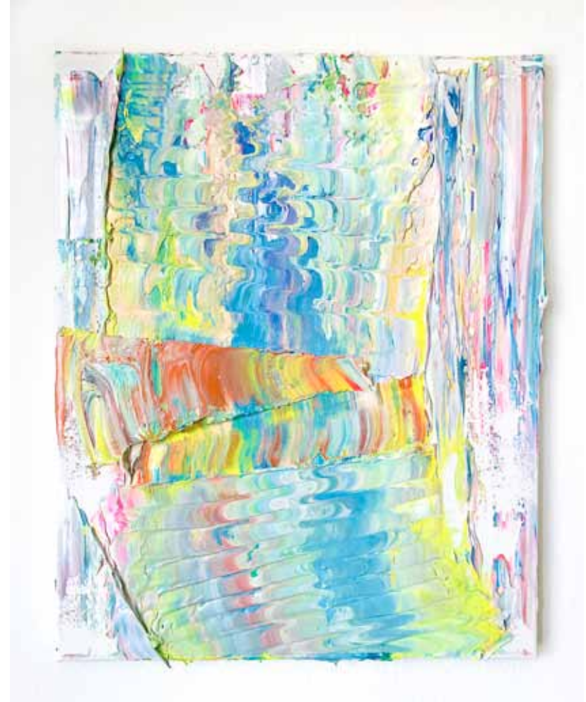
Mindscape Öl auf Gewebe 50 x 40 cm 2025