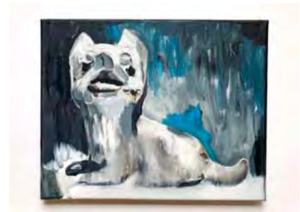
Chien chinois Öl auf Gewebe 20 x 30 cm 2025