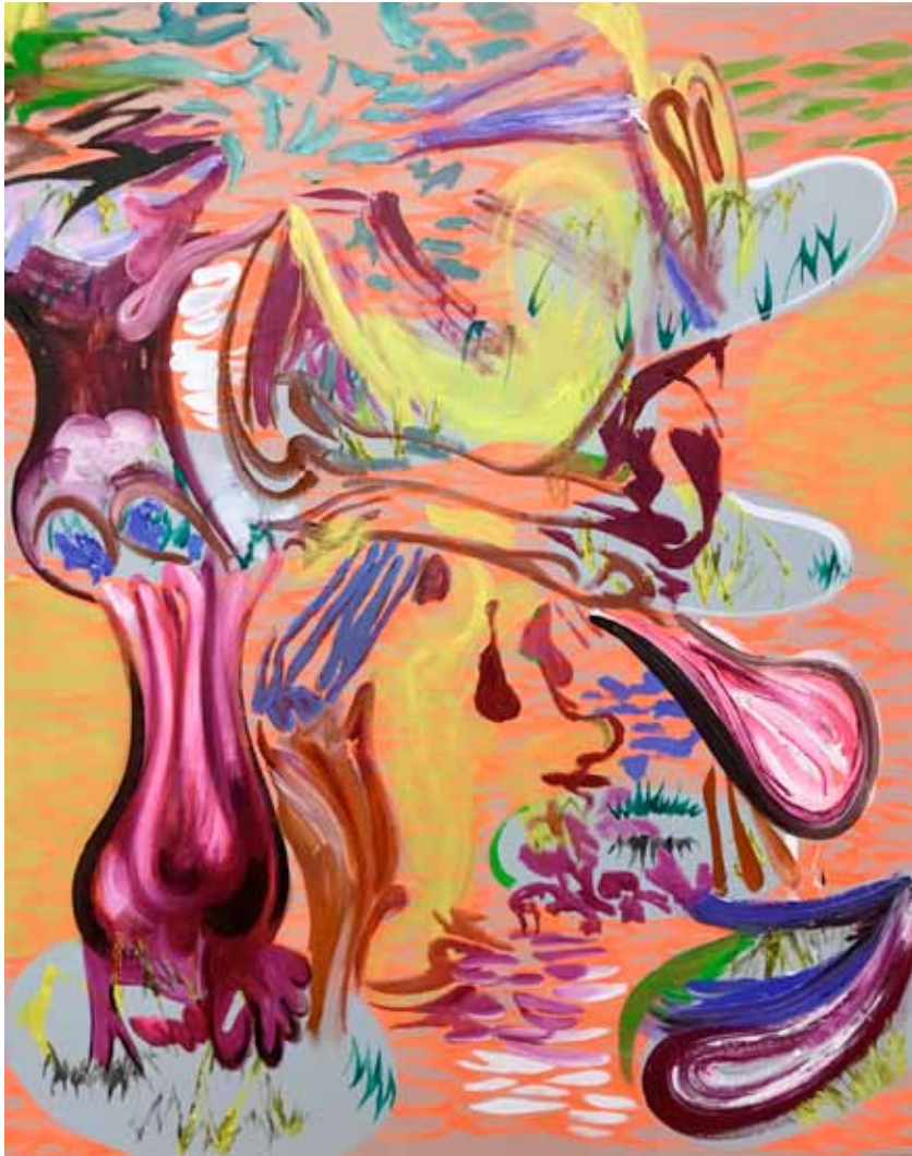
Fleeing Tree Öl auf Gewebe 150 x 120 cm 2024