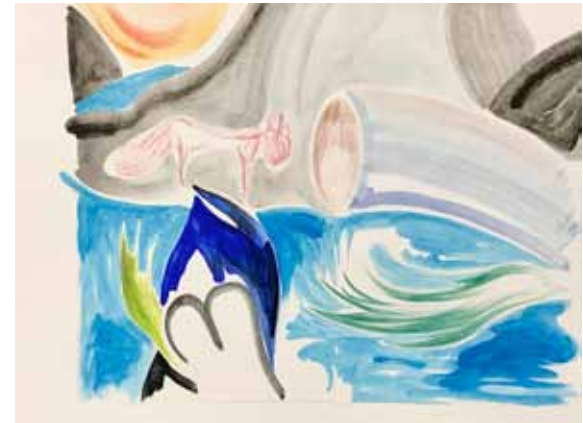
Katze am Fluss Aquarell, Farbstift 20 x 30 cm 2024