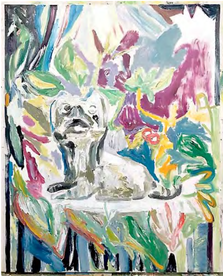
Chien chinois Öl auf Leinwand 200 x 160 cm 2026