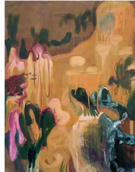
Hieronymous Path Öl auf Gewebe 90 x 70 cm 2023