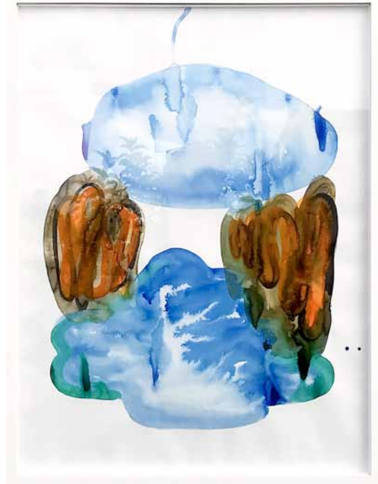
Tender Loss Aquarell 80 x 60 cm 2025