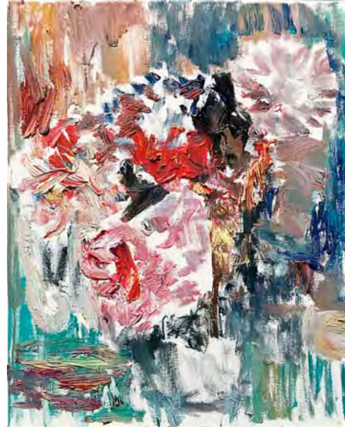
Peonies Öl auf Gewebe 50 x 40 cm 2026