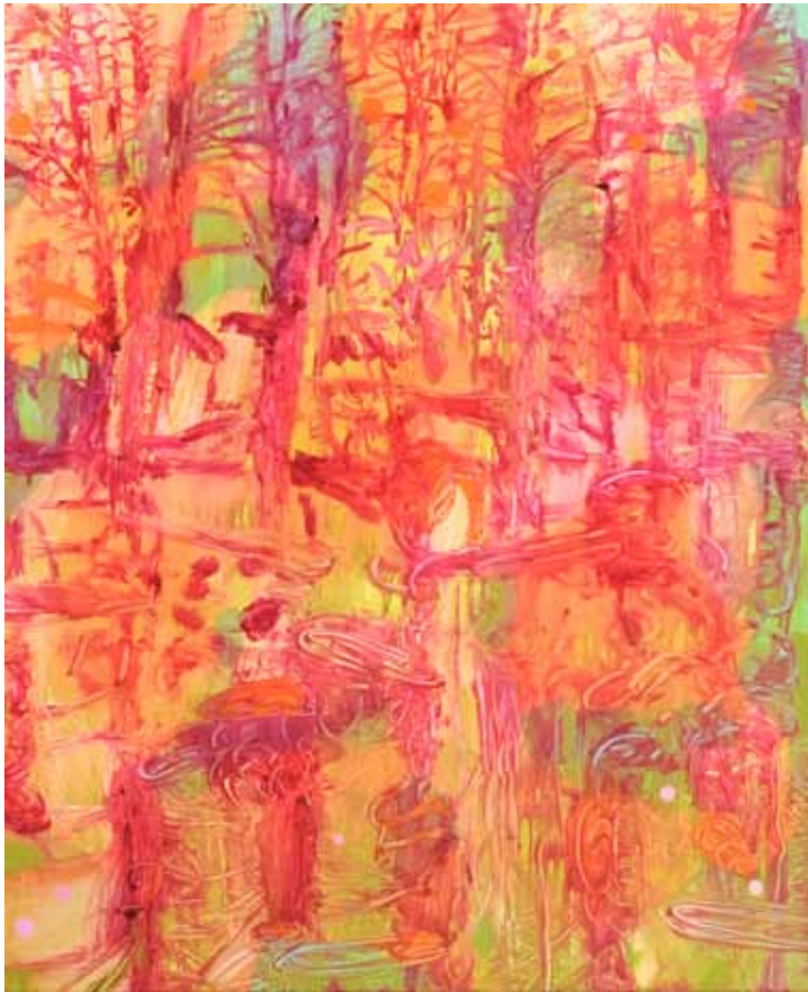
Bäume Spiegelung Öl auf Leinwand 120 x 100 cm 2023