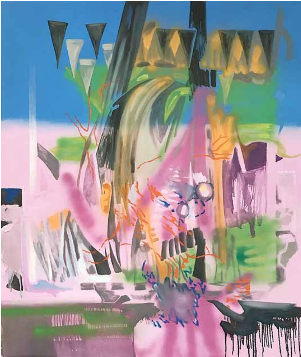
Landscape with bee Öl auf Gewebe 200 x 170 cm 2022