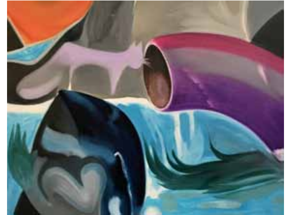
Katze am Abend Öl auf Leinwand 40 x 50 cm 2024