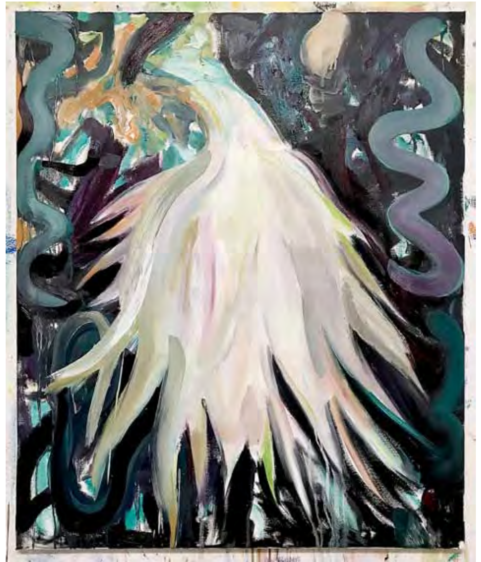
Ghostflower Öl auf Leinwand 120 x 100 cm 2026