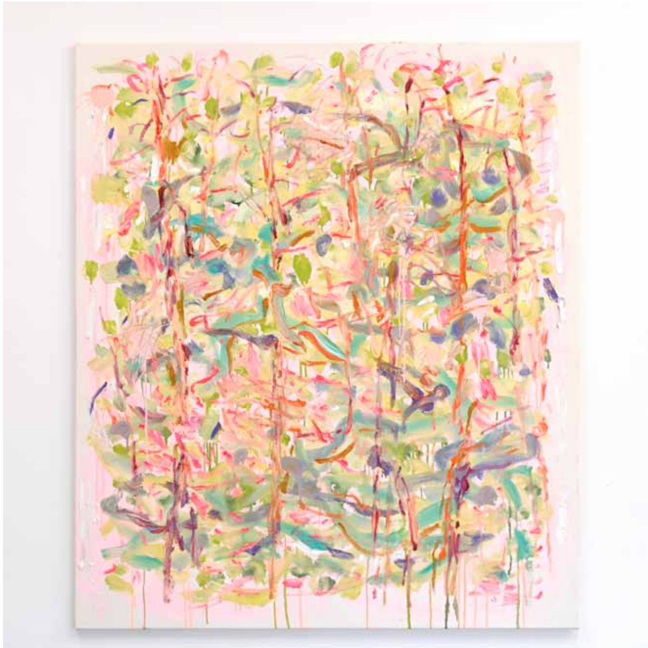
Dickicht Öl auf Gewebe 150 x 130 cm 2024